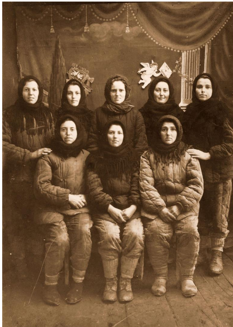
Mindennapi viselet a kényszermunkán. Korabeli műtermi felvétel másolata

egymáshoz való viszonyától függtek. Ha a tervszámokhoz képest többen jelentek meg, akkor nagyobb lehetőséget adtak a szovjetek a mentesítésekre, ha viszont kevesebben, akkor még a parancs szerinti korhatárokat is kibővítették, akár 16-65 éves korig. A települések magyar vezetői megpróbálták minél több embert mentesíteni, de a végső döntés természetesen az NKVD-s parancsnokok kezében volt. Ezért többször is előfordult, hogy egy-egy sikeres mentesítési akció után, másodszer, sőt volt, ahol harmadszor is összeszedtek embereket a „mozgósítási” parancs ürügyén, hogy a központilag tervezett létszámot produkálni tudják. A listákon szereplők összegyűjtését legtöbbször az éppen csak megalkult, s a szovjetek bizalmát élvező egykori partizánokból, szláv nemzetiségűekből, román „gárdistákból” vagy többnyire baloldaliakból álló rendfenntartók, az ún. policok végezték. S, hogy ekkoriban mennyire nem számított a trianoni határ, jól jelzi, hogy a határ magyarországi oldaláról is vittek „németeket” a szabadkai, vagy a nagykárolyi gyűjtőtáborba. Sőt még a Zemplén megyei Hercegkútról sem a közeli szerencsi, hanem az onnan 120 km-re levő, romániai szaniszlói táborba vitték az elhurcoltakat.