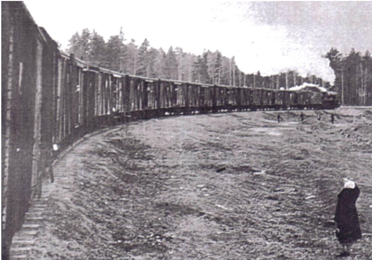
Kiszállítás a Szovjetunióba. Korabeli felvétel másolata